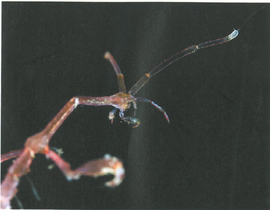
Spøkelseskreppe: Spøkelseskreppe (Caprella mutica) kan finnes på noten i merden. Til tross for at den er en invaderende art, er den blitt en del av kostholdet for både ville arter og oppdrettsarter. Det er dokumentert at både sandflyndre og laks spiser spøkelseskreppe i store mengder.

- Hydroider og blåskjell har ikke den samme problemstatusen langs hele kysten, men ved å øke oppmerksomheten rundt disse vil man kanskje oppdage at det har blitt et problem, sier Hope.